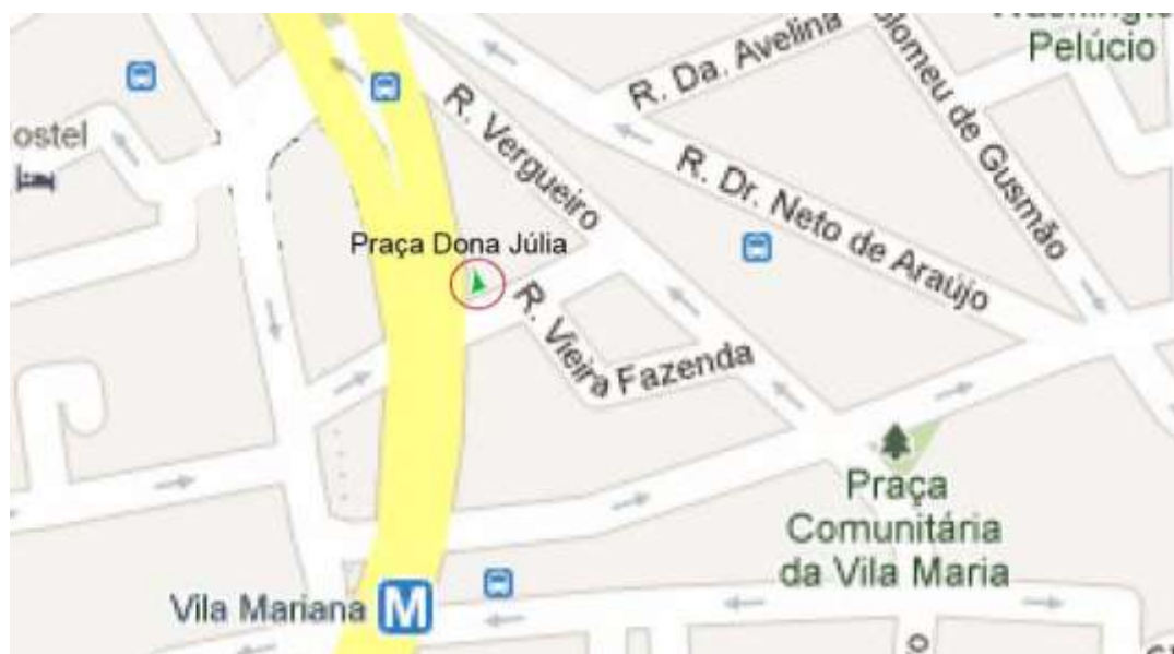
Figura 2 - Localização Referenciada Praça Dona Júlia