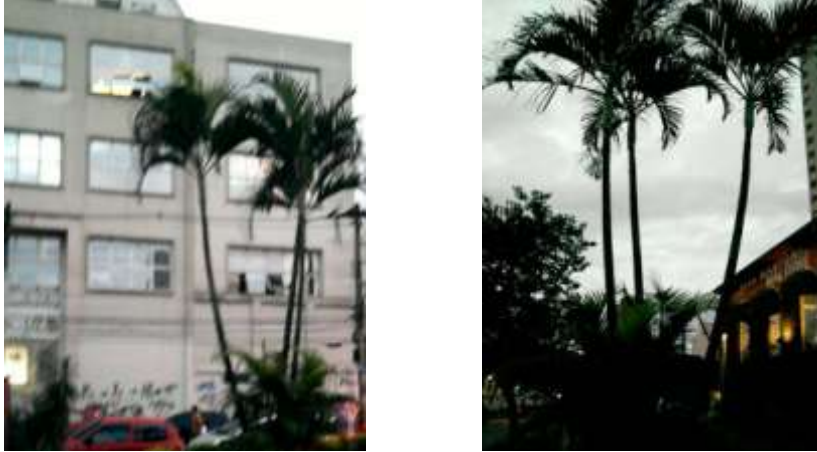
Figura 3 - Fotos do Local Fonte: Próprio Autor – Abril /2013

Com sua localização, o entorno define-se pela diversificação de usos sendo a grande maioria constituída de comércio e serviço.