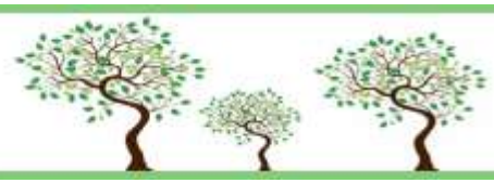
Figura 5 - Tabela Áreas Verdes