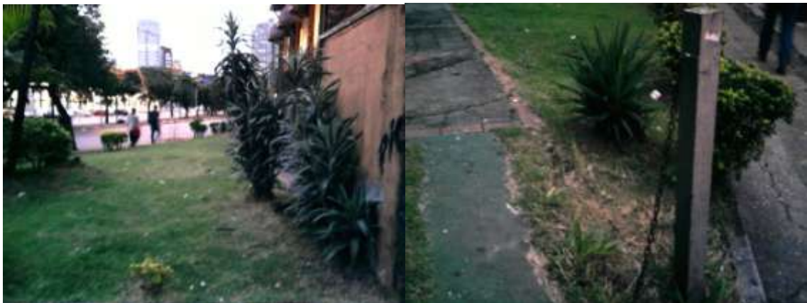
Figura 4 - Fotos do Local – Abril /2013

A praça tem uma topografia com suave desnível.