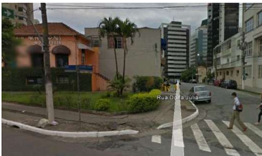
Figura 6– Acessibilidade - Google Street View