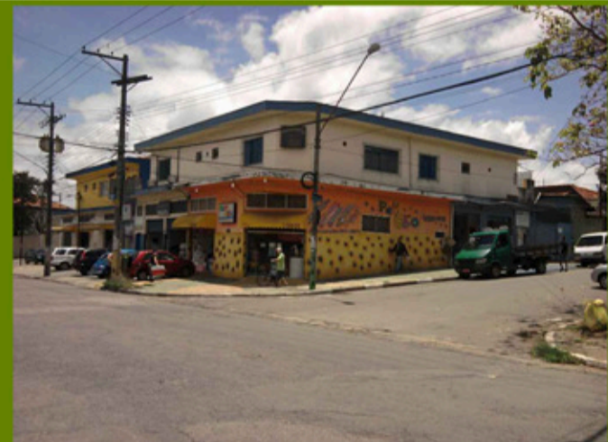
Típico comércio Local

Sendo um bairro planejado, as ruas possuem passeios agradáveis e bem arborizados, porém pouco acessíveis a para portadores de necessidades especiais.