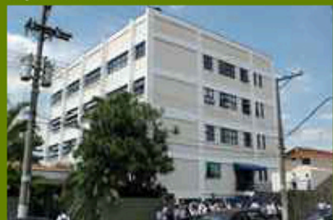
Escola de Ensino Profissionalizante